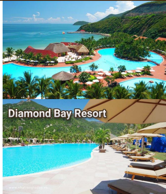
Diamond Bay Resort